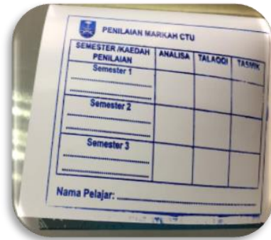
Gambar 2: Cop Penilaian Markah CTU

helaian akhir al-Quran beserta terjemahan. Ini merupakan kaedah inovatif untuk tujuan pelajar memiliki dan membawa al-Quran beserta terjemahan sepanjang kuliah CTU selama tiga semester serta memudahkan para pensyarah membuat penilaian markah serta maklumat kepada pensyarah ACIS yang bakal mengajar pelajar tersebut pada semester akan datang. Berikut adalah contoh cop penilaian markah CTU yang disediakan untuk kegunaan pensyarah ACIS.