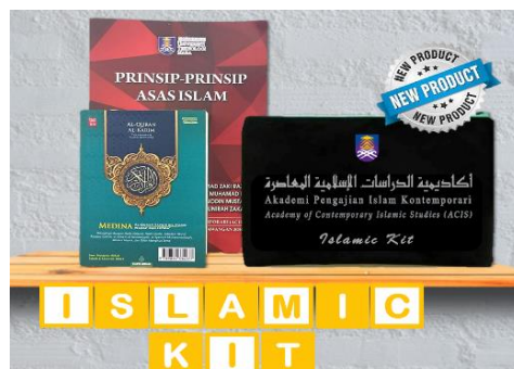
Gambar 1: Islamic Kit

Pelaksanaan Islamic kit turut disokong oleh para pensyarah ACIS, Ketua Pusat Pengajian ACIS, Timbalan Rektor Hal Ehwal Akademik (TREKHEA) dan Rektor UiTM CJKS. Ini menunjukkan bahawa betapa pentingnya al-Quran di dalam sesi PdP di dalam kelas. Berikut adalah Islamic Kit yang diperkenalkan oleh pengkaji untuk kegunaan pensyarah ACIS UiTM CJKS dan pelajar.