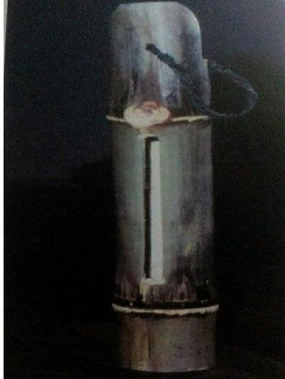
Gambar 11: Sebuah kertuk buluh

Kewujudan kertuk dikatakan bermula apabila masyarakat Melayu pada zaman dahulu mendengar bunyi patukan daripada burung belatuk yang sedang mematuk batang kayu berongga. Bunyi yang dihasilkan kemudiannya memberikan ilham kepada masyarakat pada zaman dahulu untuk menghasilkan sebuah alat yang kini dikenali sebagai kerantung (sejenis alat yang diperbuat daripada buluh / kayu nangka). Kemudiannya, masyarakat ini memutuskan untuk menggunakan alat berkenaan di kawasan pertanian dan penternakan dengan tujuan untuk menghalau burung di sawah dan memanggil haiwan ternakan pulang. Oleh itu, reka bentuk dan fungsi instrumen ini diubah suai mengikut kesesuaian tempat ia digunakan (Nur Hazirah & Ros Mahwati Ahmad Zakaria, 2020).