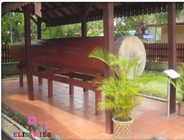
Gambar 2: Beduk yang dipamerkan di Muzium Felda Lurah Bilut