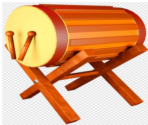
Gambar 9: Beduk yang diletakkan di atas cagak

Cagak merupakan tempat meletak beduk yang dibuat daripada kayu. Cagak dibina lebih tinggi daripada aras muka. Ketinggiannya pada kebiasaannya ialah enam kaki.. Tujuannya ialah supaya beduk yang dipalu dapat didengari dalam jarak yang lebih jauh. Ada juga beduk yang diletakkan secara digantung.