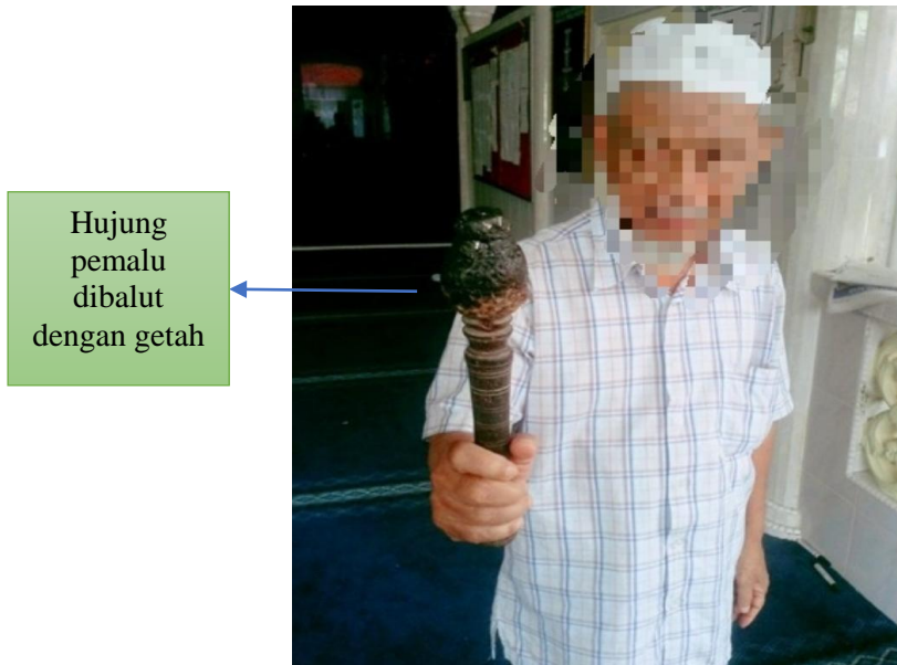
Gambar 7: Kayu pemalu

Kayu pemalu diperbuat daripada kayu yang dibalut dengan getah dihujungnya. Tujuan penggunaan getah ialah bagi menghasilkan lantunan, bunyi yang lebih kuat dan supaya belulang dapat bertahan lama.