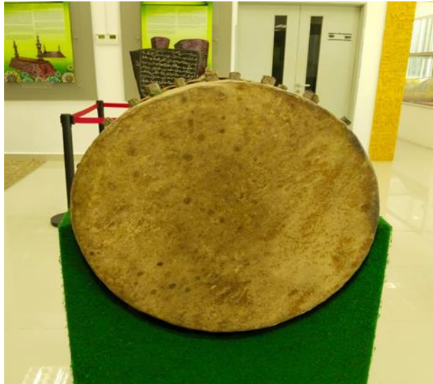
Gambar 5: Kulit yang ditampal pada kayu

Kulit yang telah kering akan ditampal kepada bahagian kayu yang telah disediakan. Untuk memastikan pemasangan kulit benar-benar tegang, baji yang dibuat daripada buluh akan digunakan. Sekiranya kulit tidak tegang, beduk yang diketuk tidak akan menghasilkan bunyi yang nyaring dan kuat. Kulit yang ditampal pada kayu tadi akan dililitkan dengan rotan sebagai hiasan.