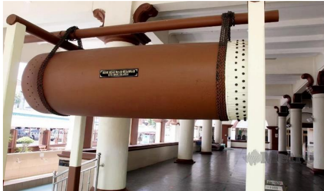
Gambar 10: Beduk yang digantung