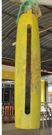
Gambar 12: Kertuk kayu atau Kerantung