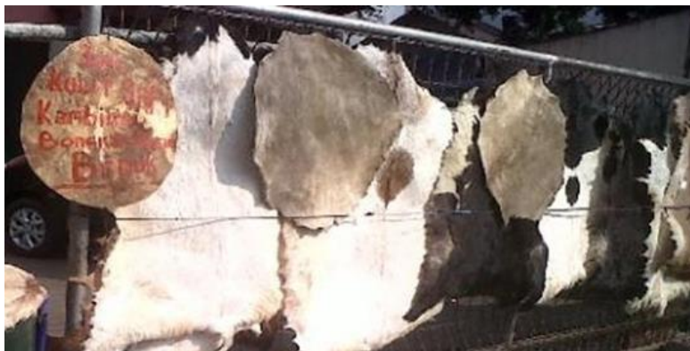
Gambar 4: Proses pengeringan kulit lembu atau kulit kerbau