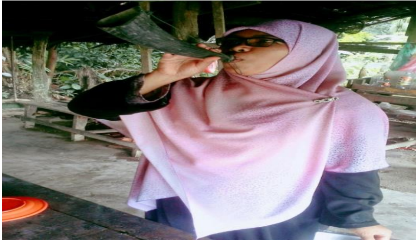
Gambar 15: Cara meniup tetuang

Pada masa dahulu tetuang tidak dimiliki oleh sebarang orang. Biasanya tetuang ini akan dipegang oleh ketua kampung, penghulu atau pun orang-orang yang diamanahkan. Ini sebagai langkah berhati-hati kerana jika tetuang dimiliki oleh orang ramai, ia tidak boleh lagi dijadikan sebagai semboyan. Dibimbangi nanti jika sekiranya semua orang meniup tetuang, tidak dapat diketahui apakah isyarat sebenar yang ingin disampaikan (Roselan, 12 Disember 2019).