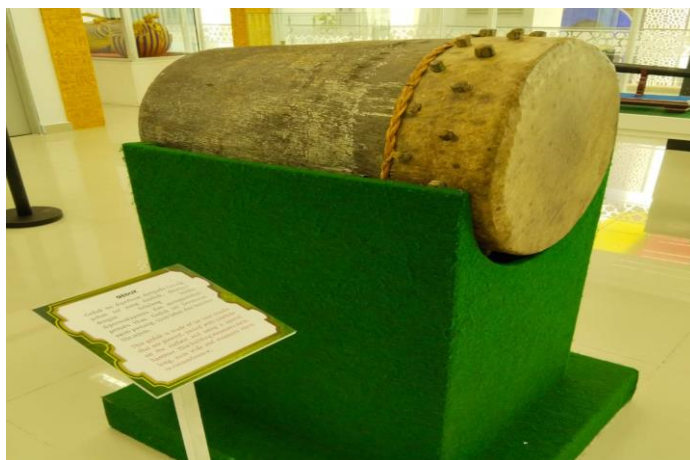
Gambar 1: Beduk yang dipamerkan di Muzium Islam Kelantan

Pada masa dahulu (sebelum adanya bekalan elektrik dan diperkenalkan penggunaan pembesar suara di masjid dan surau) bunyi beduk menjadi sebahagian daripada irama yang didendangkan dalam kehidupan seharian masyarakat Islam di Nusantara. Bunyi paluan beduk menunjukkan orang-orang Melayu dahulu telah pun terdedah dengan bunyi-bunyian yang memecahkan kesunyian sesebuah perkampungan sama ada untuk menandakan masuk waktu solat atau keraian tertentu (Raja Iskandar, 2017). Pada masa dahulu, beduk juga termasuk antara peralatan dan kemudahan yang diwakafkan di masjid atau surau/madrasah selain daripada jambatan, telaga air, mimbar, rehal dan juga meriam samada oleh individu atau masyarakat (Hasanudin & Zuliskandar, 2021). Sehingga kini beduk masih lagi tersimpan di sesetengah masjid walaupun tidak lagi digunakan. Ia juga di pameran di muzium-muzium seperti di Muzium Islam Kelantan dan Muzium Felda Lurah Bilut, Muzium Sultan Abu Bakar Pahang dan Muzium Sultan Alam Shah, Selangor sebagai pelestarian budaya Melayu dan Islam.