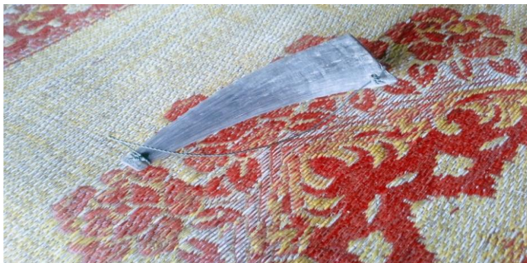
Gambar 14: Tetuang

Tetuang hanya boleh ditiup oleh orang-orang yang mahir sahaja kerana ia memerlukan teknik yang tertentu. Biasanya angin akan disimpan memenuhi mulut sehingga menyebabkan mulut menjadi bulat dan padat. Kemudian barulah tetuang akan ditiup. Mereka yang tidak mahir tentang teknik ini, tidak dapat mengeluarkan bunyi apabila ianya ditiup. Biasanya tetuang hanya terdapat di surau-surau kecil di kampung (PK2, 2021).