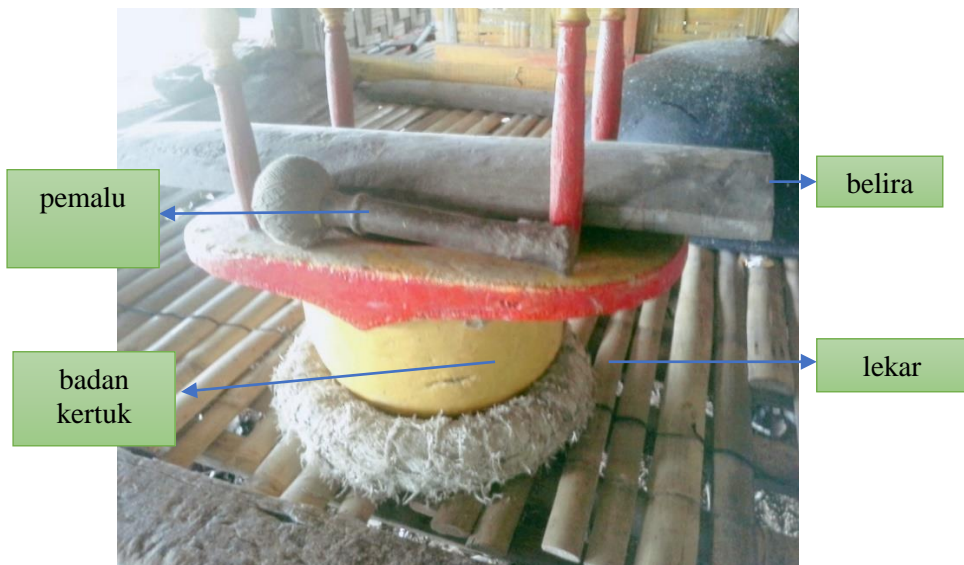
Gambar 13: Kertuk beserta pemalunya yang terdapat di Kg Sila, Tok Uban, Kelantan

Kertuk kelapa diperbuat daripada buah kelapa serta kayu dan berbentuk sedikit bulat. Selain daripada pemberitahuan waktu solat, kertuk kelapa juga dimainkan semasa sambutan perayaan tertentu. Kertuk menjadi medium bagi menyampaikan sesuatu perkhabaran kepada penduduk di sesebuah kampung. Ia juga digunakan oleh penanam padi bagi menghalau burung pada musim padi masak.