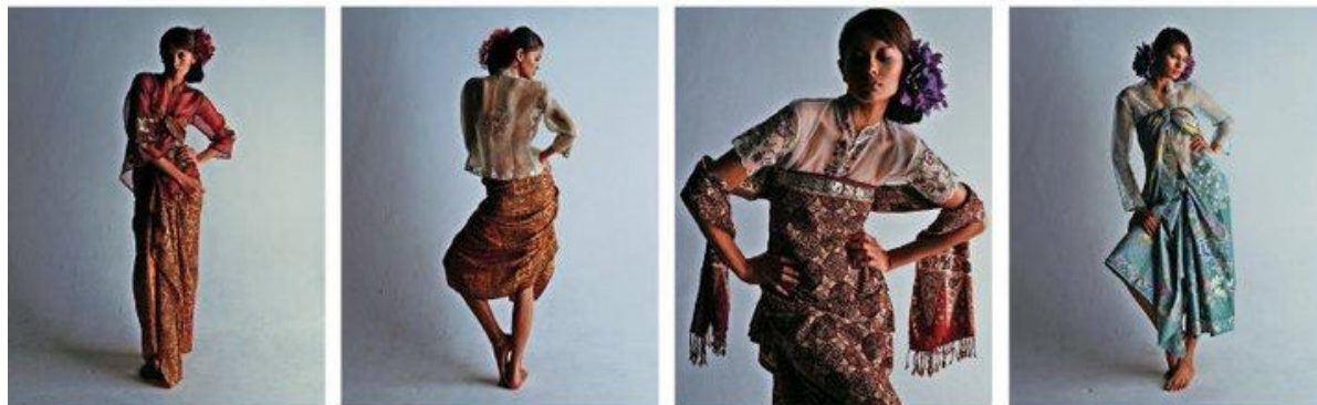
Ilustrasi 2 : Imej fotografi yang di hasilkan majalah Glam bertemakan kebaya moden. Penata Gaya oleh Wei Chun

Dalam temubual bersama Wei Chun (2023) pengarah seni yang banyak menghasilkan karya muka hadapan majalah serta fesyen komersial, budaya dan fesyen saling berkait dan memerlukan antara satu sama lain dan ianya merupakan medium komunikasi dalam penyampaian secara lisan. Ujarnya model warga tempatan Melayu menggayakan busana bangsa Melayu akan nampak lebih indah dengan keaslian yang dipaparkan dan model warga selain Melayu akan memberi impak berbeza penerimaannya oleh pembaca di semua platform media atas faktor penerimaan dan secara langsung mempromosi budaya di pentas luar.