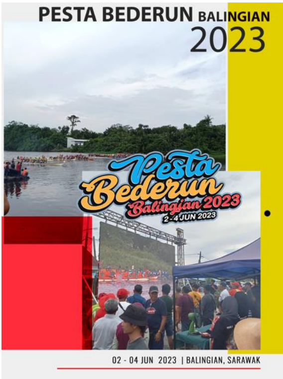
Gambar 1: Pertandingan perlumbaan perahu semasa pesta bederun