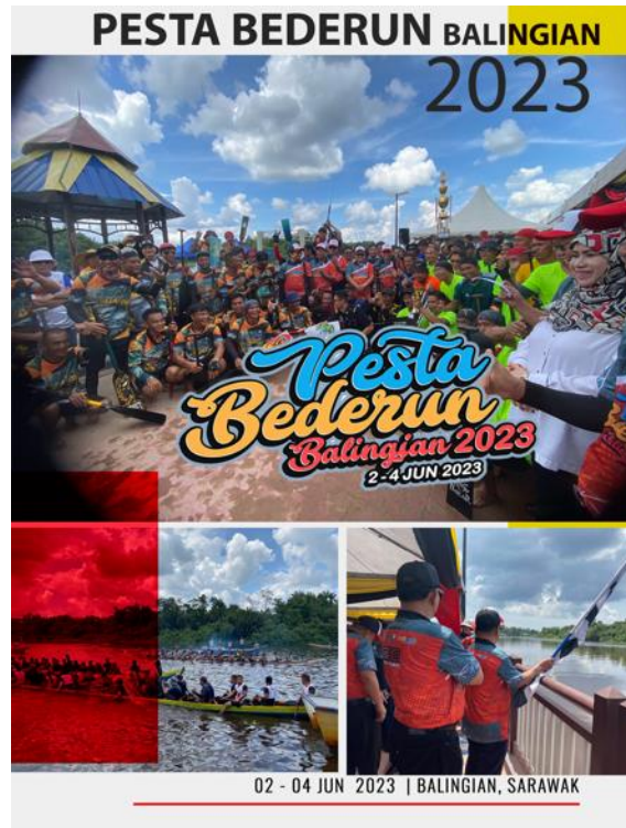
Gambar 4: Para pemenang acara utama Pesta Bederun yang dinobatkan sebagai Raja Sungai Pesta Bederun Balingian 2023