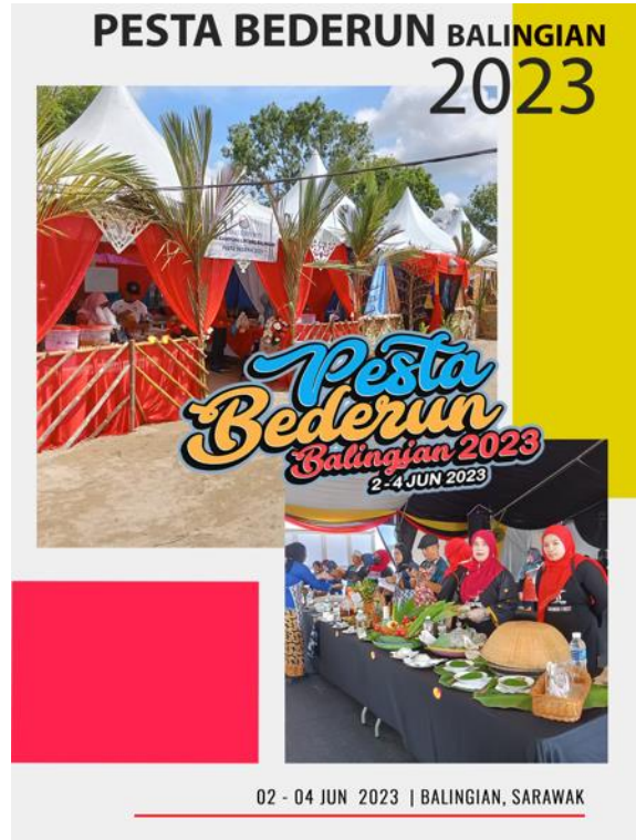
Gambar 2: Gerai menyediakan juadah masakan tradisional masyarakat Melanau di Balingian