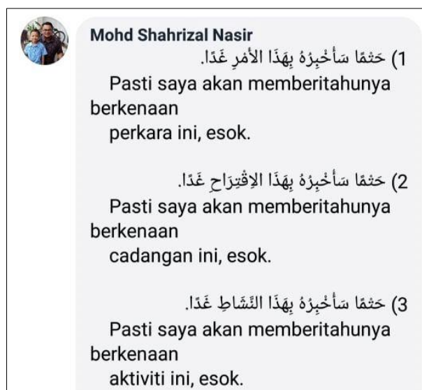
Rajah 4: Paparan Contoh Bahan Pengajaran Bahasa Arab