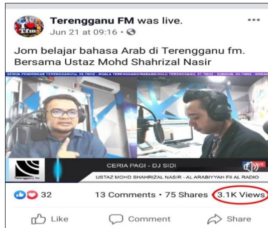
Rajah 3: Paparan Jumlah Views Rancangan Al-Arabiyyah Fi Al-Radio

Sepertimana yang dinyatakan sebelum ini, kemudahan Live Video membuka ruang yang luas untuk rancangan Al-Arabiyyah Fi Al-Radio dapat diakses oleh orang ramai bukan sahaja di negeri Terengganu malah di serata dunia. Ini dapat dilihat berdasarkan rekod bilangan penonton yang dinyatakan oleh Facebook ® pada paparan Live Video yang ditunjukkan pada Rajah 3 (Facebook ® Radio Malaysia Terengganu FM, 2019a). Rancangan ini juga boleh dikongsi ( share ) kepada pengguna Facebook ® lain tanpa had. Tambahan pula Facebook ® dikenali sebagai salah satu jaringan sosial yang mempunyai ramai pengguna berdaftar. Menurut Cardon (2009), terdapat sembilan laman jaringan sosial yang mempunyai lebih daripada 50 juta ahli berdaftar dan sejak November 2008, dengan hampir 50 laman jaringan sosial mempunyai lebih daripada satu juta pengguna berdaftar termasuk Facebook ® . Selain itu, kemudahan Live Video ini juga membolehkan orang ramai mengikuti rancangan Al-Arabiyyah Fi Al-Radio pada luar waktu siaran langsung kerana ia direkod secara kekal selagi tidak dipadam oleh penyelenggara Live Video bagi Facebook ® Radio Malaysia Terengganu FM.