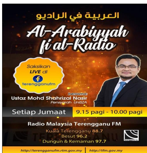
Rajah 2: Paparan Poster Rancangan Al-Arabiyyah Fi Al-Radio

Carrera dan rakan-rakan (2008) menyatakan bahawa Facebook® membolehkan pengguna menggunakan papan mesej ( message board ) dan dinding perbincangan ( discussion wall ) untuk membuat pengumuman dan pertanyaan soalan (Waters et al., 2009). Justeru, promosi rancangan Al-Arabiyyah Fi Al-Radio dapat diperhebatkan dengan sebaran poster rancangan yang dimuat naik dalam laman media sosial Facebook® pengajar rancangan, stesen Radio Malaysia Terengganu FM dan para pengguna Facebook® yang lain. Cara ini secara langsung dapat memperkenalkan rancangan kepada para pendengar bukan sahaja yang berada di negeri Terengganu, malah pendengar di serata dunia dengan mengikuti rancangan menerusi Live Video . Poster akan dimuat naik pada setiap hari Jumaat sebelum berlangsungnya rancangan Al-Arabiyyah Fi Al-Radio .