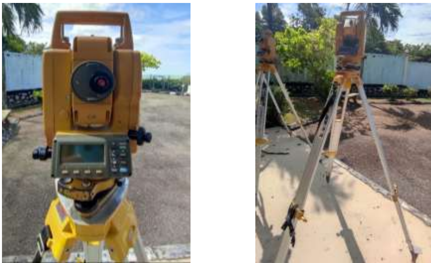
Gambar Rajah 1: Alat Ukur ( Total Station ) Yang Digunakan Untuk Mengukur Semula Arah Kiblat

Lokasi kajian yang dipilih tersebut merangkumi 3 buah daerah iaitu Jasin, Alor Gajah dan Melaka Tengah. Sepanjang proses semakan dan pengukuran semula dijalankan oleh pihak Jabatan Mufti Melaka dan Jabatan Ukur dan Pemetaan Malaysia (JUPEM), pelbagai peralatan yang telah digunakan antaranya total station , GPS, pelan titik sempadan yang telah diakses daripada pihak JUPEM dan Kompas Prismatic Ushikata.