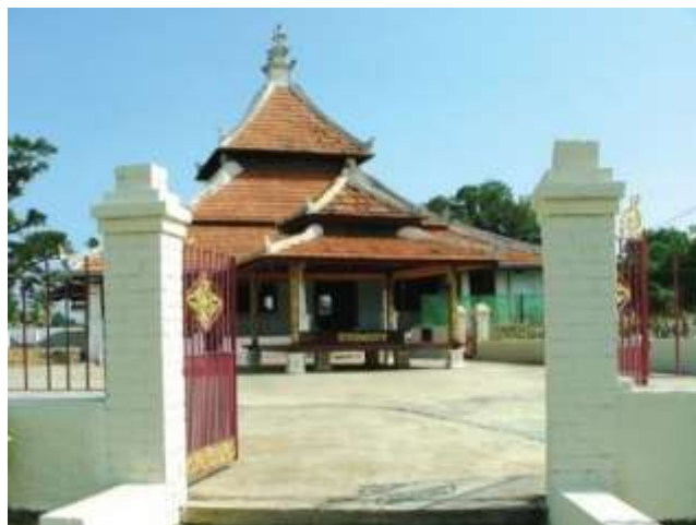
Gambar Rajah 4: Masjid An Nur Peringgit (Mula dibina pada tahun 1756)

*Arah kiblat asal masjid yang diukur semula menggunakan peralatan ukur