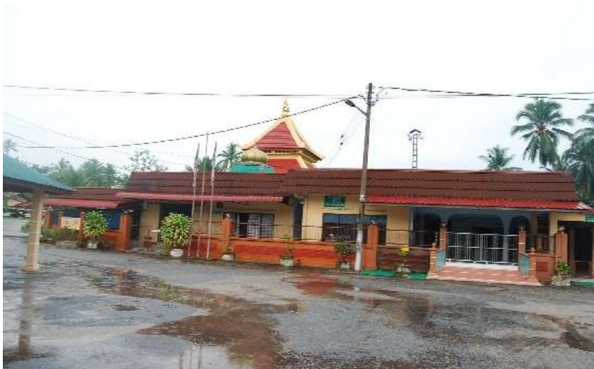
Gambar Rajah 2: Masjid As-Solihin Kampung Sebatu (Mula dibina pada tahun 1901)