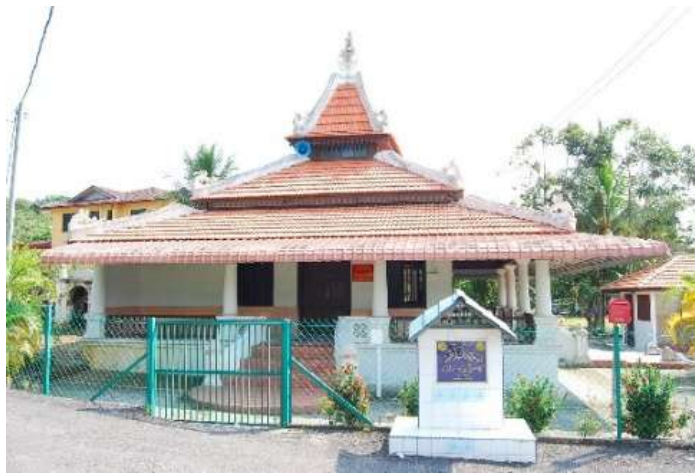
Gambar Rajah 3: Masjid Lama Kg. Parit Melana (Mula dibina pada tahun 1920)