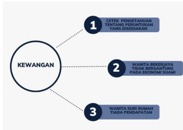
Rajah 2 Faktor Kewangan