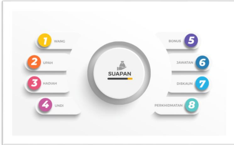
Rajah 1: Bentuk-bentuk Rasuah Semasa

Mutakhir ini, gejala rasuah semakin berleluasa dalam kalangan masyarakat Malaysia. Gejala ini bukan hanya melibatkan pegawai berpangkat rendah, malah turut menjebak golongan berstatus tinggi. Menurut satu laporan akhbar Sinar Harian (2021), hampir separuh kes rasuah melibatkan penjawat awam. 8 Baru-baru ini, Indeks Persepsi Rasuah (CPI) Malaysia mencatatkan kejatuhan daripada tangga 51 kepada 57 berbanding tahun 2019. 9 Bagi memberikan gambaran yang lebih jelas betapa seriusnya jenayah ini di Malaysia, kajian mengumpulkan laporan kes mengikut tahun bermula 2016-2020 seperti berikut: 10