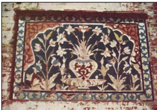
Gambar 6: Jubin berkaca pada pintu masuk timur