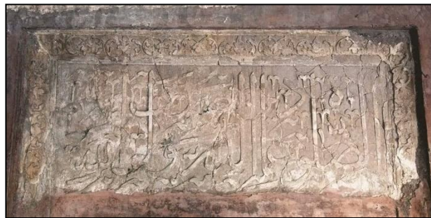
Gambar 9: Inskripsi dalam masjid

Hiasan kaligrafi, inskripsi, corak arabesque dan motif flora yang terdapat pada jubin kaca Sarai Amanat Khan ini merupakan elemen-elemen kesenian yang indah dan menarik. Campuran gaya Hindu-Muslim ini terkenal pada zaman pemerintahan Akbar (1556-1605M) dan Jahangir (1605-1627M). Meskipun begitu, gaya kesenian ini berakhir pada zaman pemerintahan Shah Jahan (1627-1658M) kerana ia telah dilarang oleh pemerintah pada tahun 1632M (Radzan, 2018). Pada tahun 1958, seni bina Sarai Amanat Khan ini telah diisytiharkan sebagai monumen kepentingan negara di bawah Akta Monumen Purba dan Tapak Arkeologi dan Tinggalan (AMASR). Kemudian, Teja (2018) melaporkan bahawa Jabatan Pelancongan dan Hal Ehwal Kebudayaan mengambil inisiatif membangunkan Sarai Amanat Khan sebagai destinasi pelancongan.