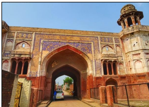
Gambar 3: Pintu masuk timur (Delhi Darwaza)

“The central recess containing the entrance arch is framed by bands of inscription rendered in glazed tiles. Fine floral arabesque designs adorn the spandrels. The central arch is flanked by arches recesses at ground level and triple openings on the second storey. These triple openings were filled with trellis-work, some of which is still extant on the left side of the western gateway. Above these triple openings are oblong panels depicting flower and vase designs against white background (Gambar 5). Whereas the flowers are in orange and two shades of blue, the leaves are in green. In the corners and in the other parts are square and oblong panels depicting the same motif (Gambar 6). The rest of the surface of the gateway was covered with red painted plaster with brick pattern in white incised in it.”