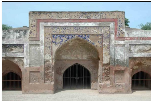
Gambar 7: Jubin berkaca pada pintu masuk timur

Seterusnya, hiasan kaligrafi juga dapat dilihat pada pintu masuk masjid. Masjid ini dibina di bahagian tengah kiri kompleks Sarai Amanat Khan (Gambar 1). Reka bentuk masjid ini mempunyai tiga kubah berbentuk bulat dan tiga pintu yang mengarah ke bahagian dalam masjid. Setiap pintu ini dihiasi dengan kaligrafi dalam ayat-ayat Parsi dan motif bunga dalam jubin kaca biru seperti yang ditunjukkan pada gambar 7. Manakala bahagian dalaman masjid juga dihias indah dengan lukisan motif flora dan inskripsi pada dindingnya (Begley, 1983). Walau bagaimanapun, ia menunjukkan hiasan-hiasan ini semakin pudar mengikut peredaran masa.