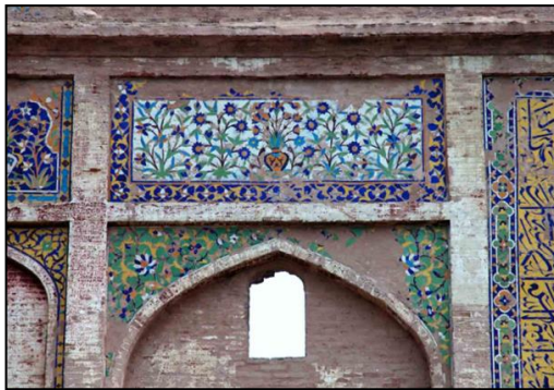
Gambar 5: Jubin berkaca pada pintu masuk barat