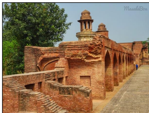
Gambar 2: Kandang Sarai Amanat Khan