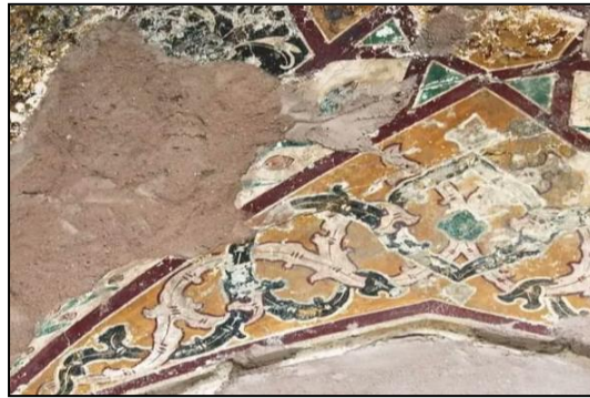
Gambar 8: Lukisan motif flora