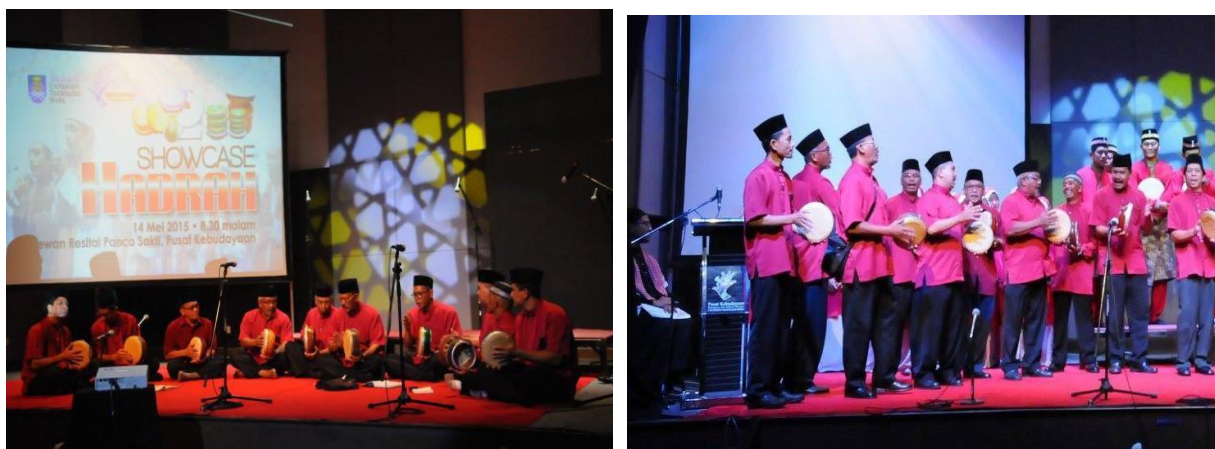
Gambar 7: Persembahan permainan Rebana Perak di satu majlis pertunjukan Hadrah

Setiap lagu yang dinyanyikan terbahagi kepada dua bahagian iaitu bahagian syair dan hadi. Pada bahagian syair, paluan menggunakan pukulan panjang manakala di bahagian hadi menggunakan pukulan pendek. Pada dasarnya tiada kiraan yang khusus bagi pukulan panjang atau pendek. Bilangan pukulan akan disesuaikan mengikut jenis dan rentak lagu yang dimainkan.