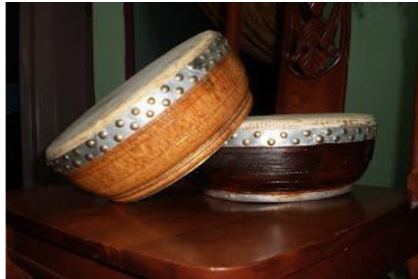
Gambar 1: Bentuk Rebana Perak

pengantin yang sedang bersanding atau majlis berkhatan. Bagi persembahan di sesuatu pertandingan pula biasanya Rebana Perak dimainkan dalam kedudukan berdiri.