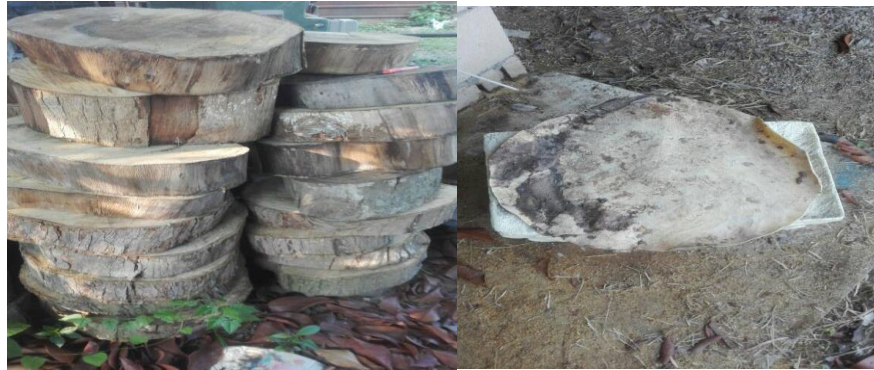
Gambar 2: Bahan utama membuat Rebana Perak (Kayu Halban dan kulit lembu)

Rebana Perak diperbuat daripada dua bahan utama iaitu kayu dan kulit seperti Gambar 2. Kayu yang menjadi bingkai atau rangka rebana ini adalah dari jenis kayu halban, nangka dan kayu sungai. Manakala kulit yang bertindak sebagai diafram atau bahagian yang di talu adalah dari kulit lembu dan kerbau. Kulit lembu dan kerbau dikatakan menghasilkan bunyi yang lebih sedap didengar berbanding kulit kambing. Gambar 3 menunjukkan peralatan Utama membuat Rebana Perak yang terdiri dari mesin pelarik dan alat penarik rebana.