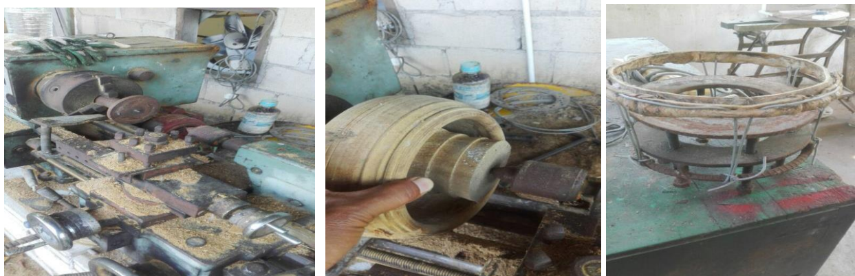
Gambar 3: Peralatan Utama membuat Rebana Perak (mesin pelarik dan alat penarik rebana)