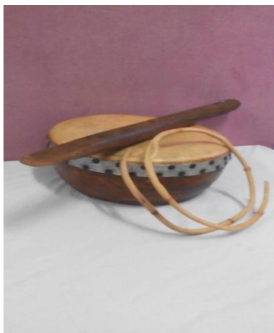
Gambar 4: Gelungan rotan dan kayu penyedak