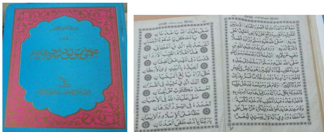
Gambar 5: Kitab Maulud Shariful Anam