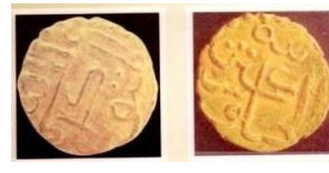
iii. Duit emas bertulisan Arab