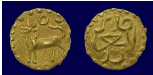
i. Duit syiling kijang

Matahari atau bunga yang menunjukkan terdapat gambar bunga matahari dan di bahagian belakangnya bertulis perkataan ' Malik al-'Adil '; dan (3) duit emas bertulisan Arab di kedua-dua belah muka yang ditempat dengan perkataan ' al-Julus Kelantan ' bermaksud Kerajaan Kelantan dan sebelah bahagian lagi bertulis ' Khalifatulrahman ', dan ada juga menggunakan tulisan ' Khalifat al-Mu'minin ' dan sebelahnya lagi ' Malik al-'Adil ' .