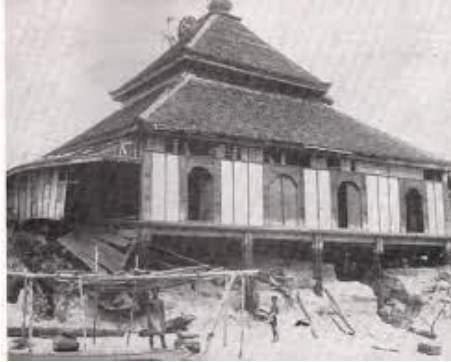
i. Pada awal pembinaan iaitu 1720M