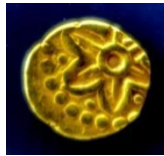
ii. Duit syiling Matahari