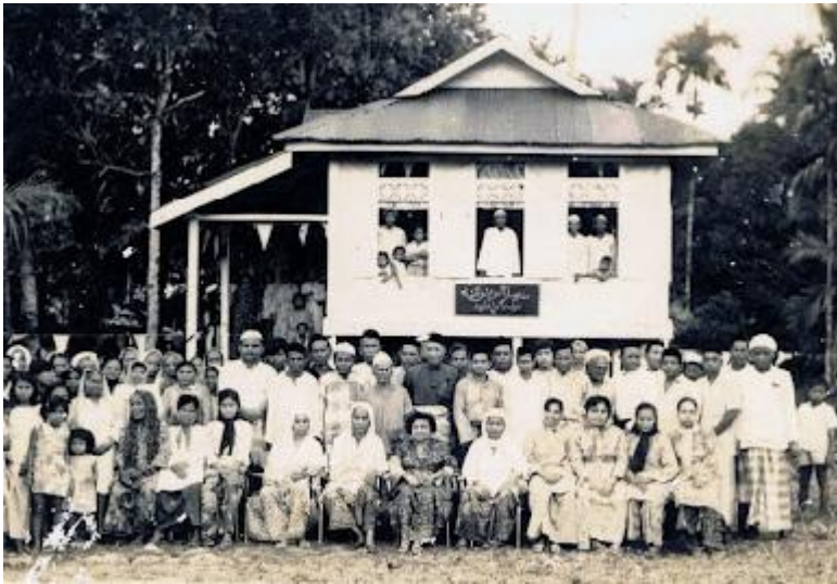
Rajah 3: Pondok terawal di Pulau Condong, Kelantan