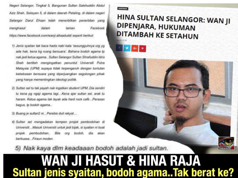
Rajah 1