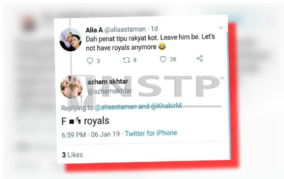
Rajah 2: Petikan komen menjejaskan melalui Twitter

Kenyataan menghina tersebut dibuat selepas Sultan Kelantan, Sultan Muhammad V, mengumumkan peletakan jawatan baginda sebagai Yang di-Pertuan Agong. Petikan Komen yang menjejaskan itu boleh dilihat melalui rajah 2 di bawah. Walaupun dalam kes ini sepasang suami isteri tersebut belum lagi didakwa di mahkamah, tetapi pihak majikan masing-masing telah mengambil tindakan sedemikian sebagai menunjukkan mereka adalah warganegara yang menghormati amalan budaya rakyat Malaysia serta mengamalkan prinsip rukun Negara iaitu Kesetiaan kepada raja dan negara serta kesopanan dan kesusilaan.