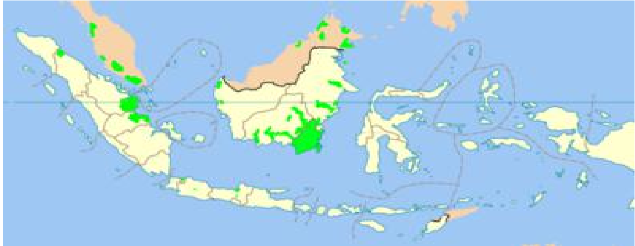
RAJAH 2. Peta penyebaran suku bangsa Banjar

Walaupun penghijrahan mereka sudah beratus ratus tahun lamanya, namun, penggunaan bahasa Banjar khususnya berkaitan aspek leksikal tertentu tidak pernah luput dan terus digunakan pada hari ini untuk tujuan komunikasi dan difahami oleh masyarakat Banjar di semua peringkat umur.