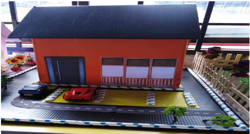
Gambar 5 : Home Sweet Home (R4)

Responden ke 3 (R3) Apabila di beri peluang untuk menerangkan hasil kerja kepada rakan-rakan yang lain, beliau cuba bercakap tetapi dengan nada suara yang perlahan dan memintal jarinya. Beliau menerangkan ayahnya menggunakan cat minyak untuk mewarnakan dinding dan bumbung rumah. Beliau menerangkan bahawa ini rumah nenek.