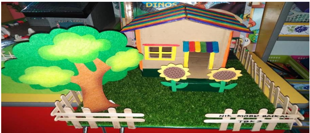
Gambar 2: Home Sweet Home (R1)

Hasil pemerhatian selepas melaksanakan intervensi Projek ' Home Sweet Home ' di dapati mereka dapat menyiapkan tugas yang diberikan mengikut masa yang telah ditetapkan. Persoalan kajian tercapai dengan peningkatan pelibatan kanak-kanak bersama ibu bapa dalam pengajaran dan pembelajaran di kelas TABIKA. Hal ini di buktikan dengan semua reponden membawa hasil Projek ' Home Sweet Home ' ke Kelas TABIKA dengan ekspresi yang ceria. Dapatan daripada intervensi ini juga, didapati kestabilan emosi dan peningkatan minat dalam pembelajaran di kelas juga telah meningkat. Dapatan kajian ini juga dilihat berjaya membantu pelibatan kanak-kanak bersama ibu bapa pembelajaran di TABIKA dengan kerjasama yang dapat dilihat melalui pembinaan model rumah ' Home Sweet Home ' dengan menggunakan kreativiti masing-masing. Projek ini juga dapat membantu kanak-kanak seronok ke TABIKA. Daripada hasil kerja yang telah dipamerkan, dapati ibu bapa menghasilkan model rumah yang pelbagai dengan penuh kasih sayang.