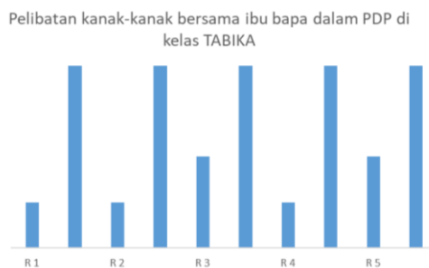
Carta 1 : Senarai semak penglibatan kanak-kanak

Kajian ini menggunakan kaedah pemerhatian dengan menggunakan senarai semak. Hasil dapatan pemerhatian ini ditunjukkan melalui carta palang di bawah :