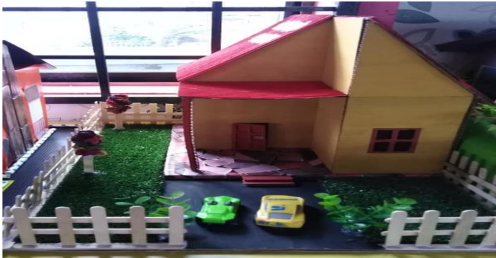
Gambar 6 : Home Sweet Home (R5)

Responden ke 4 (R4) Apabila Projek Home Sweet Home ini dilaksanakan, perubahan tingkahlaku yang sangat membanggakan. Beliau tidak lagi mengusik dan mengacau rakan yang lain, malahan beliau menjadi pendorong dan berlumba-lumba untuk menyiapkan tugas yang diberikan. Beliau telah menerangkan mengenai Home Sweet Home beliau yang mempunyai 2 biji kereta. Beliau menerangkan bahawa itu adalah kereta idamannya. Beliau sangat teruja berkongsi pengalaman dan impiannya kepada rakan-rakan. Hal ini juga terbukti bahawa keberkesanan intervensi yang telah dilaksanakan.