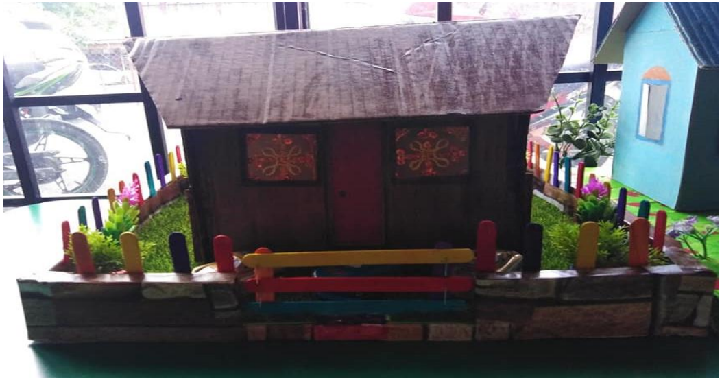
Gambar 4 : Home Sweet Home (R3)

Responden ke 3 (R3) Apabila di beri peluang untuk menerangkan hasil kerja kepada rakan-rakan yang lain, beliau cuba bercakap tetapi dengan nada suara yang perlahan dan memintal jarinya. Beliau menerangkan ayahnya menggunakan cat minyak untuk mewarnakan dinding dan bumbung rumah. Beliau menerangkan bahawa ini rumah nenek.