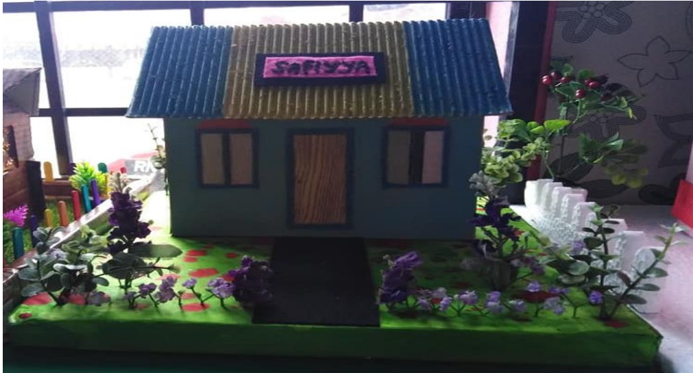
Gambar 3: Home Sweet Home (R2)

Responden 1 (R1) telah hadir ke kelas dengan muka dan perasaan yang gembira. Dari keluar kereta ibunya lagi, R1 tidak sabar untuk menunjukkan hasil kerjanya kepada rakan-rakan di kelas. Hal ini sangat membanggakan kerana perubahan sikap dan tingkahlaku yang positif telah ditunjukkan oleh R1. Beliau juga telah bercerita bagaimana mereka membina Home Sweet Home bersama ibu bapanya. R1 menceritakan bahan yang digunakan di ambil dari bahan terpakai seperti kayu ais krim. Selain itu, mereka menggunakan kotak untuk membentuk rumah dan menggunakan pelbagai bahan lain untuk membentuk pokok dan rumput.